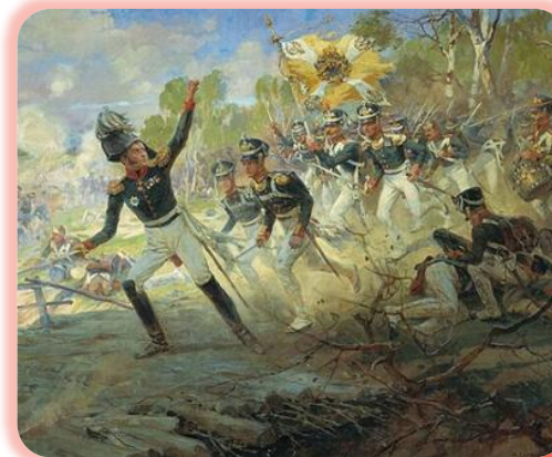
Н. С. Самокиш «Подвиг солдат Раевского под Салтановкой», 1912

Названы улицы в г. Грозный, г. Гудермес.